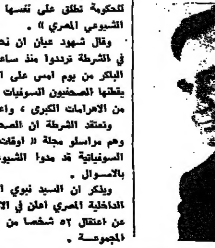
القسم - اجتمع ظهر امس السيد منحيم بيجن رئيس الوزراء بالمشاور القانوني للحكومة المصرية...